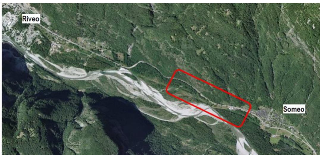
Figura 1: Zona d'intervento

Il percorso è situato a monte della Strada Cantonale e si sviluppa sul sedime un tempo occupato dalla linea ferroviaria della “Valmaggina”, smantellata agli inizi degli anni '60 del secolo scorso. Con riferimento alla Strada Cantonale P407, l'intervento si estende dalla PR 70+515 alla PR 80+495. Il limite dell'intervento verso Ponte Brolla coincide con l'intersezione della strada cantonale con la principale strada comunale di Someo, ai confini settentrionali dell'abitato.